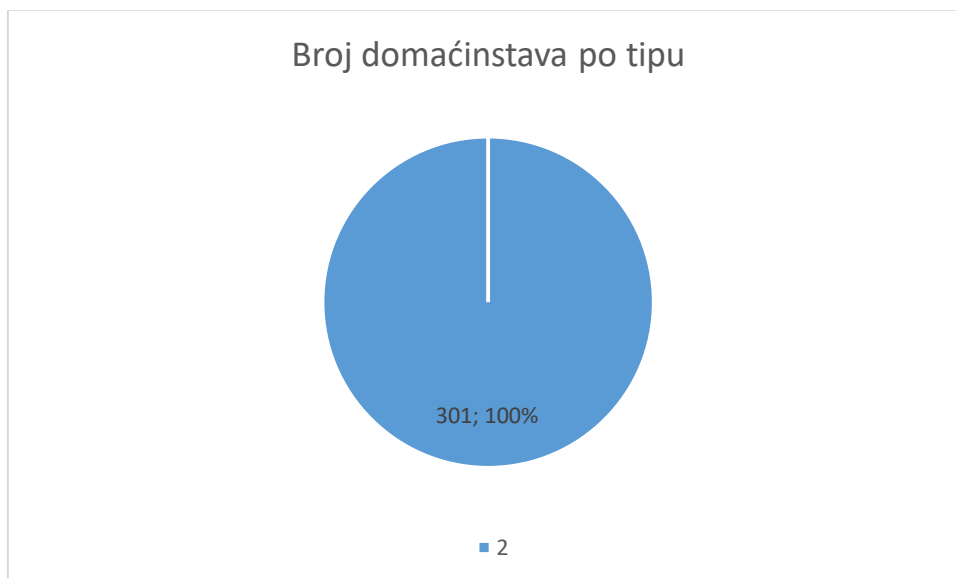
Grafikon 1: Broj anketiranih sistematizovan prema tipu domaćinstva izražen nominalno i procentualno

Iz prethodnog grafikona se vidi da je od ukupnog broja anketiranih, 301 korisnik sa individualnim vodomjerom, što čini 100% anketiranih. Veliku razliku između broja anketiranih domaćinstava sa zajedničkim i individualnim vodomjerom možemo objasniti trendom sve većeg uvođenja individualnih vodomjera i podatkom da je u općini Doboj Istok postoje dvije stambene zgrade u kojima su smještene izbjegla lica.