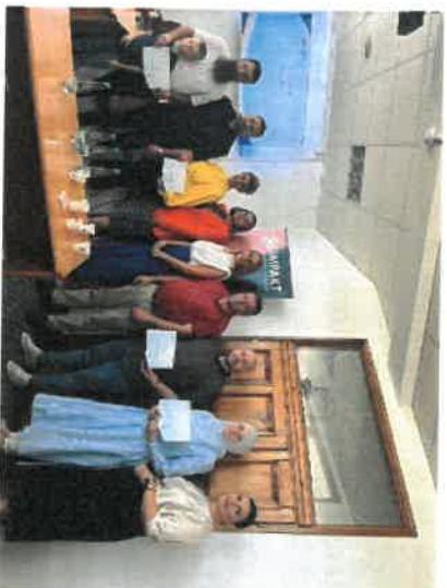
Slika 2 - Finalna prezentacija

Rang lista prezentiranih poslovnih ideja u okviru IMPAKT inkubatora poslovnih ideja Općine Doboju Istok je potpisana od strane sva četiri člana, te je svaki član zadržao svoj primjerak.