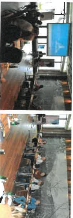
Slika 8 - Radionica sa koordinatorima, LPZ, Jahorina

srednjoročnom i godišnjem planiranju kao platformi cjelokupnog razvoja lokalne zajednice.