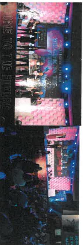
Slika 6. Welcome to the future

Iz oblasti poreske pismenosti održan je ciklus webinara kroz tri teme: