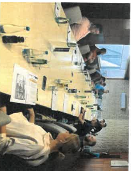
Slika 3 - Radionica sa poduzetnicima iz građevinskog sektora, Tuzla

perspektive preduzeća; mogućnosti finansiranja uvođenja principa cirkularne ekonomije u poslovanje u BiH.