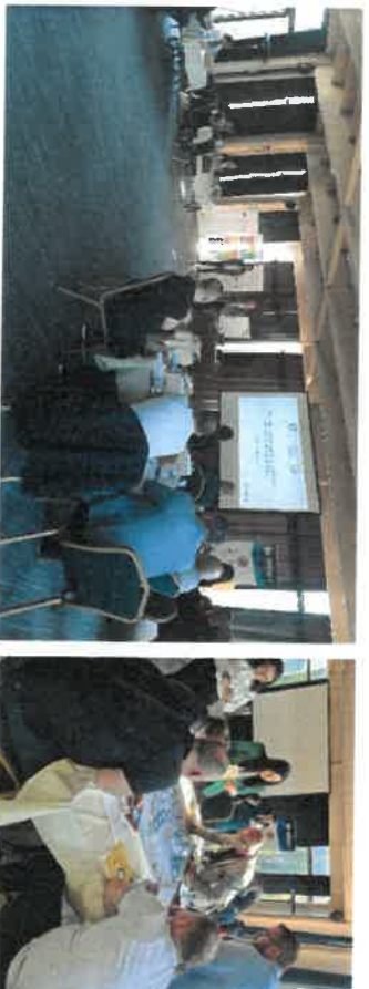
Slika 9 - Jačanje kapaciteta LPZ, Trebević

Kao nastavak izgradnje kapaciteta lokalnih zajednica, održana je obuka iz Značaja Agende 2030 i ciljeva održivog razvoja, korištenjem interaktivnog alata te lokalne zelene ekonomije i potencijalima za primjenu u lokalnim zajednicama, a koja je održana u periodu od 19. do 21. oktobra 2022. godine (Trebević) na kojoj su učestvovali predstavnici općine Doboj Istok. Zaključci sa ove radionice su dostavljene svim učesnicima, a neke od ključnih preporuka su da lokalne zajednice trebaju komunicirati i prepoznati ciljeve održivog razvoja u komunikacijskim planovima, te razvijati svijest da se promocija poduzetništva uvrsti u budžet lokalnih zajednica. Također, preporuka je da se ugovore gostovanja na lokalnim TV i radio stanicama te pruži prilika za poduzetnike koji su podržani kroz inkubator poslovnih ideja da prezentuju svoje biznise. Nadalje, i okviru Dana grada potrebno je promovisati program i poduzetnike koji su ili dijelom istog u svrhu slanja afirmativne poruke svim poduzetnicima te učestvovati u aktivnostima Globalne sedmice poduzetništva realizacijom različitih aktivnosti kako u lokalnim zajednicama tako i u obrazovnim institucijama putem radionica, informativnih događaja, dana otvorenih vrata kako bi se promovisalo lokalno poduzetništvo.