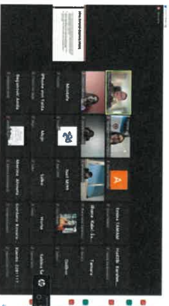
Slika 4 - HACCP - Osnove i primjena

pregled HACCP sistema. Upoznati su sa mogućnostima HACCP sistema, kao i njegovu primjenu u svim fazama proizvodnje jednog prehrambenog proizvoda.