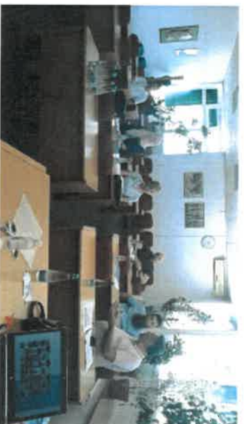
Slika 1 Poduzetnička obuka

Metodologija poduzetničkog programa je u ovom periodu dodatno unaprijeđena principima zelene, odnosno cirkularne ekonomije ugrađujući koncept 3R (reuse, recycle, reduce). Cilj je potaći učesnike da razmišljaju o uticaju poslovanja na okoliš, gdje svaka odluka kada je u pitanju zelena ekonomija ima dva stuba: ekonomski motiv i predviđanje uticaja na okoliš. Pokušavamo učesnicima ukazati na važnost eko-dizajna, koji ne dizajnira „zelene proizvode“ nego proizvode kod kojih je životni ciklus ekološki prihvatljiv što znači da se ne misli samo na uticaj proizvoda tokom njegove upotrebe nego tokom cjelokupnog životnog ciklusa, uključujući fazu odlaganja. Vodeći se eko-dizajn principima, proizvod je dugotrajniji (durable) sa tehničke tačke gledišta i po mogućnosti sa mogućnošću nadogradnje (upgradable) i ima za cilj smanjenje utroška količine materijala za korištenje, ali ne na uštrb kvaliteta, i to ne samo sirovinu nego i energiju za njegovo kreiranje. Eco-efficiency je koncept koji se bavi resursima, obimom proizvedenih proizvoda i uticajem proizvodnje na okoliš. Zahtijeva tehnologije koje su u mogućnosti transformacije sirovina sa što manjom emisijom. Uvode se termini kao što su ekološki troškovi i zeleno računovodstvo kojem je cilj baviti se istim. U skladu sa očekivanjima, tokom treninga došlo je do smanjenja grupe učesnika tako da su u konačnici 3 učesnika predstavila svoje poslovne planove.