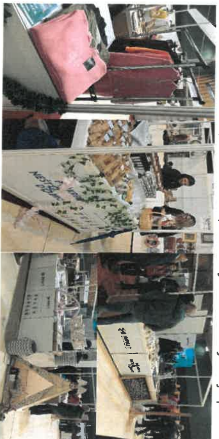
Slika 5 - Sajam bh. privrede, Sarajevo

obuke koju su dobili od investicijske fondacije Impakt ali i još važnije mentorsku podršku i praćenje nakon što su registrovali i započeli poslovanje a kako bi povećali prodaju, promovisali svoje proizvode i usluge i dobili cjelokupnu podršku i mentorstvo. Učešće u sajmu je za većinu poduzetnika bilo prvo iskustvo tako da su cijenili priliku da prezentuju svoje biznise, ali i da se upoznaju sa drugim poduzetnicima i ostvare poslovne kontakte i saradnje, a fondacija Impakt je identifikovala potrebe za daljom mentorskom podrškom za neke od poduzetnika te su dogovorene konkretne aktivnosti, kao što su promotivna podrška za neke biznise ili organizacija strateških planiranja za one kojima je potrebno.