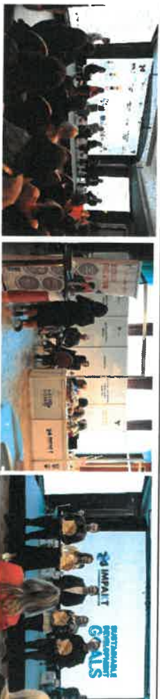
Slika 7 - Pokreni nešto dobro u Tuzlanskom kantonu